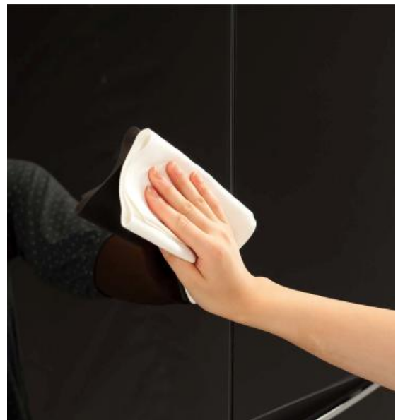
汚れやすい扉のお手入れもしやすい「ガラスストップ」

冷蔵庫はガスレンジ以上に、家族やお客さまの目に触れる機会が多いため、美しさを保つ「ガラスストップ冷蔵庫」は今後、ガスレンジのように定着して行くと考えています。