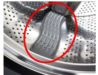
<洗濯板状のバツフル>

日本の洗濯の原点であり、最近注目が高まっている「洗濯板」。その洗い方の特徴である布傷みの少なさと、洗浄力の高さに注目して開発した洗濯板状のバツフルを引き続き搭載。当社独自の3つの洗濯板状のバツフルをドラム内部に配置し、手で揉んだり、擦ったりするように丁寧に洗うので、頑固な泥汚れまでしっかり落とします。また、タオルを洗う場合、通常のドラム式の「たたき洗い」とは異なり、洗濯板状のバツフルで倒れたタオルのパイルを起こしながら洗うため、天日干してもゴワつきを抑えることができます。