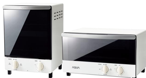
AQT-WT2(W)ホワイト AQT-WA1(W)ホワイト

設置スペースに合わせて選べるよう、タテ型とヨコ型をラインナップ。どちらも前面にミラー調のガラスを採用した、スタイリッシュな外観です。調理中は庫内が見えるので便利です。