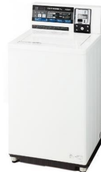
コイン式全自動洗濯機 MCW-C70L