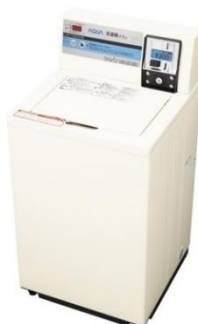
コイン式全自動洗濯機 MCW-45