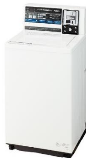
コイン式全自動洗濯機 MCW-C50L