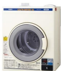
コイン式電気衣類乾燥機 MCD-CK45