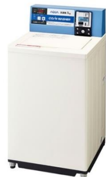
コイン式全自動洗濯機 MCW-70A MCW-70