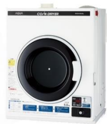
コイン式電気衣類乾燥機 MCD-CK50L