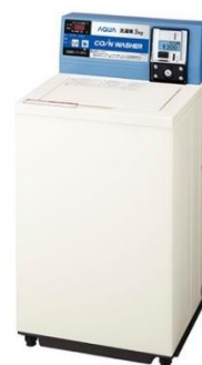
コイン式全自動洗濯機 MCW-50A MCW-50