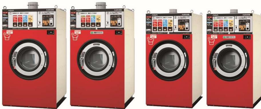
コイン式全自動洗濯乾燥機 HWD-7277GC, HWD-7277GCO, HWD-7177GC, HWD-7177GCO