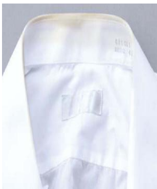
オゾンすすぎ無し