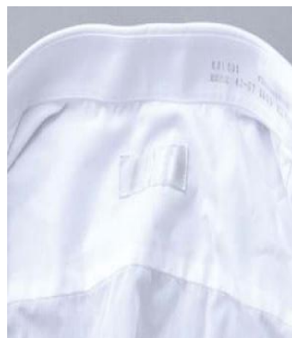
オゾンすすぎ有り