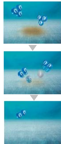
オゾンすすぎの 洗浄イメージ

泥汚れを洗う「洗濯板」と皮脂汚れ・ニオイ汚れを洗う「オゾンすすぎ」の2回洗いができるから、衣類に汚れを残さず、しっかり洗い上げることができます。