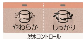
図5: 脱水コントロールボタン

洗濯の脱水回転数を通常より低くして衣類のしわ付きを抑える「やわらか脱水」は、しわになりやすい衣類やデリケートな衣類、脱水による型崩れが気になる衣類などに便利です。また、脱水回転数を通常より高めてしっかり絞る「しっかり脱水」は、厚物衣類や天候が悪いとき、早く乾かしたいときなどに便利です。これらは、「脱水のみコース」でも選ぶことができるので、手洗い時の「脱水のみ運転」にも最適です。