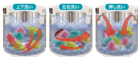
図3: 洗浄イメージ図

循環水量がアップし、脱水槽と外槽との間の水 を有効利用することで節水洗濯を実現しました。