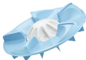
ツインパルセーター