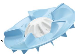
図1: ツインパルセーター

外側のパルセーターは左右非対称形状により、水の循環と衣類のかくはんに必要なダイナミックな水流を作り出します。