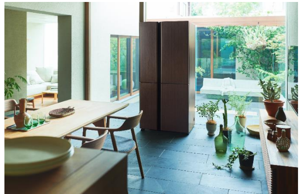
AQUA 冷凍冷蔵庫「TZ シリーズ」 AQR-TZ51H(S) サテンシルバー / AQR-TZ51H(T) ダークウッドブラウン

昨今、SNSなどで自分の価値観やライフスタイルをオープンにする傾向が日々高まっています。今までキッチンの奥にあった冷蔵庫も、自分らしさを表現するためのアイテムの一つとして注目されつつあります。