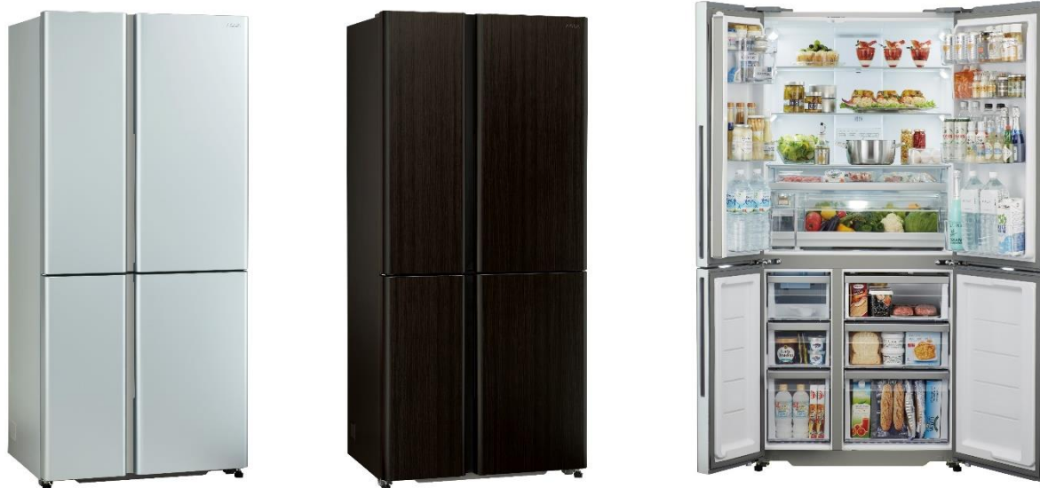
AQUA 冷凍冷蔵庫「TZシリーズ」 AQR-TZ51H(S) サテンシルバー / AQR-TZ51H(T) ダークウッドブラウン