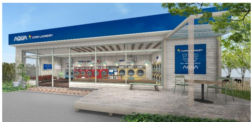
次世代店舗イメージ