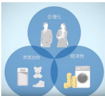
市場拡大の背景3要素