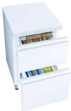
COOL CABINET EX