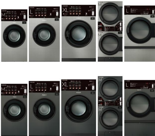
コインランドリー用機器 Superior シリーズ