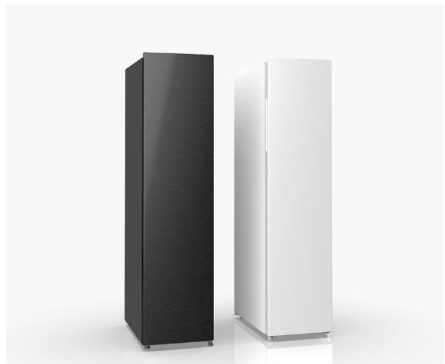
家庭用冷凍庫 スリムフリーザー AQF-SF11

※ 国内コインランドリー用機器(洗濯乾燥機・洗濯機・ガス乾燥機)において。2022年10月7日現在。当社調べ。