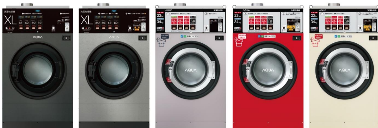
コズミックグレー (G) ムーンシルバー (S) ワインシルバー (WW) パワフルレッド サンドベージュ (W)