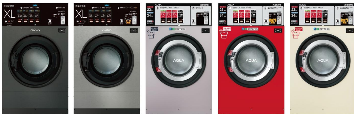
コズミックグレー (G) ムーンシルバー (S) ワインシルバー (WW) パワフルレッド サンドベージュ (W)

今年4月に当社が発売したコインランドリー用 超大型コイン式全自動洗濯乾燥機「HWD-7347AGC(洗濯容量34kg/洗濯乾燥容量23kg)」は、まとめ洗いによる一回あたりの洗濯物量の増加や、大物洗いのニーズに対応するべく開発いたしました。