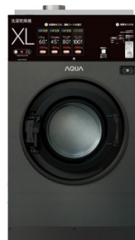
(G)コズミックグレー