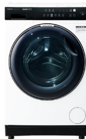
ドラム式洗濯乾燥機 (W)ホワイト