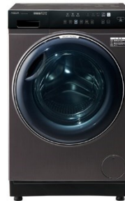
AQW-DX12P (K)シルキーブラック