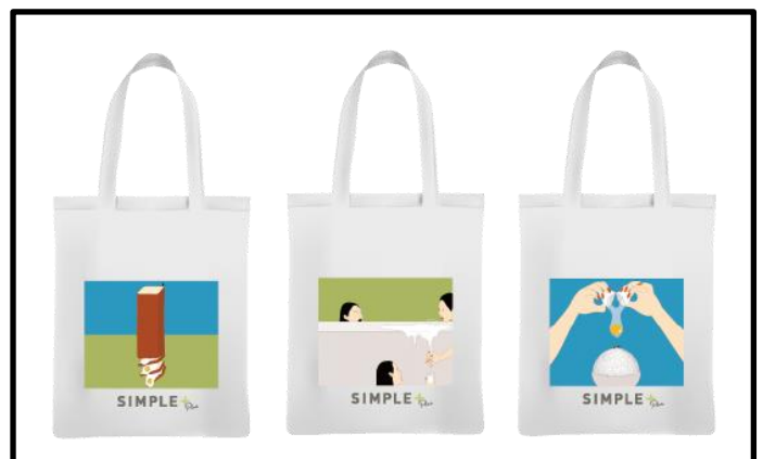
オリジナルトートバッグ