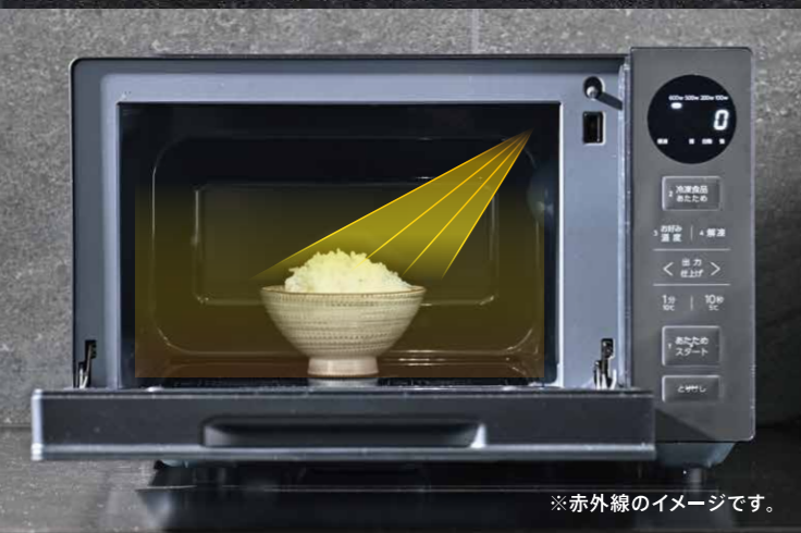
※赤外線のイメージです。

※1高周波出力900Wは短時間高出力機能(最大3分間)であり、調理中自動的に600Wに切り換わります。この機能は自動あたためではたきません。