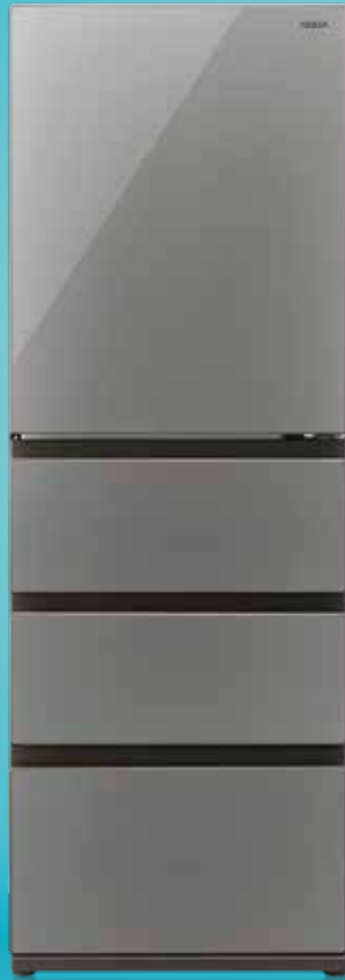
AQR-VZ37P2 (S) クリアシルバー