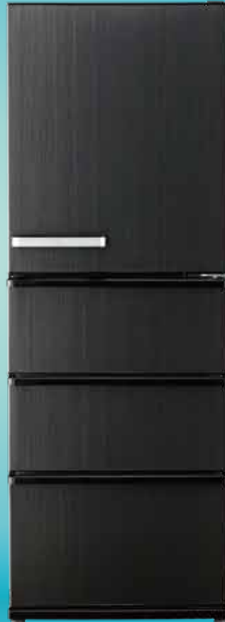
AQR-V37P2 (K) ウッドブラック