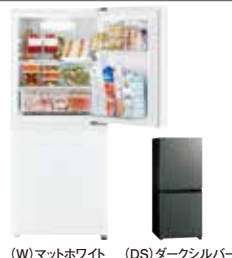
(W) マットホワイト (DS) ダークシルバー