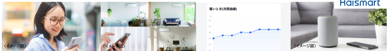
外出先からスマホで遠隔操作

詳しくはこちら https://aqua-has.com/lp/aircon_haismart/