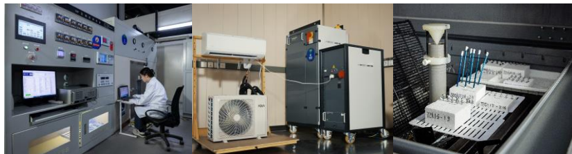
部品性能評価試験