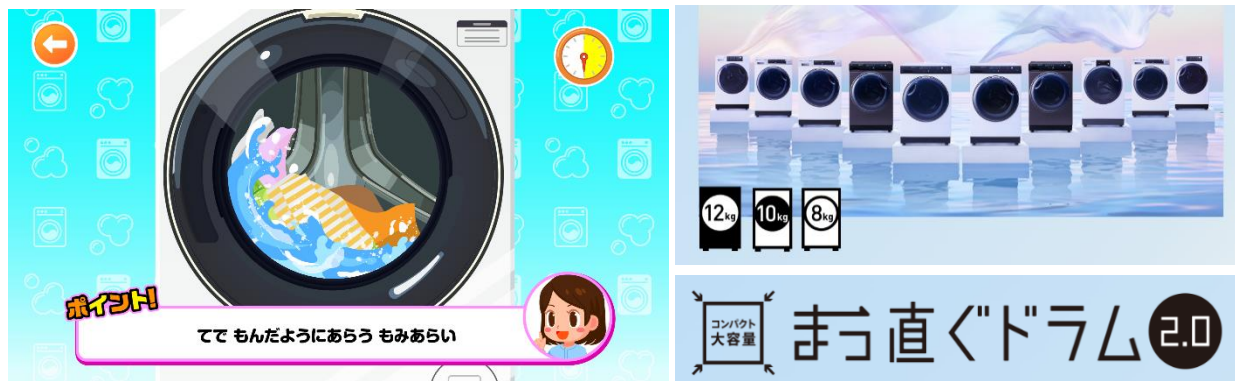
AQUA「まっ直ぐドラム」での洗濯を疑似体験できる「まっすぐドラムでせんたくたいけん」

「まっ直ぐドラム」紹介 URL: https://aqua-has.com/lp/laundry/drumseries/