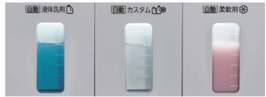
液体洗剤 カスタムタンク 柔軟剤