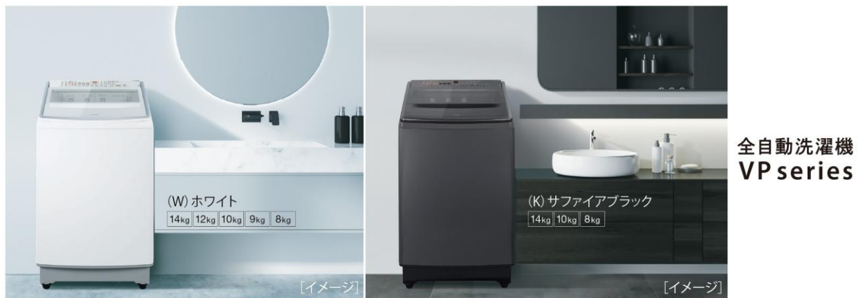
全自動洗濯機 VP series